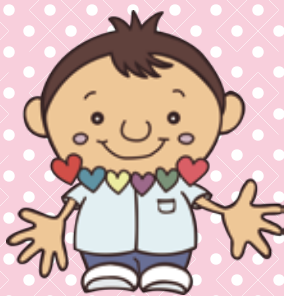
一般社団法人栃木県老人保健施設協会 マスコットキャラクター けあちゃん